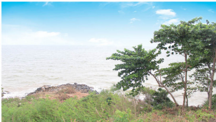
Đuôi Hà Bá, xã Hòn Tre

Located at the end of Tre Island, Duoi Ha Ba is a place with many dangerous torrents, so fishing boats do not often travel in this area. However, this is a destination that attracts tourists, especially young people who love adventure and discovery.