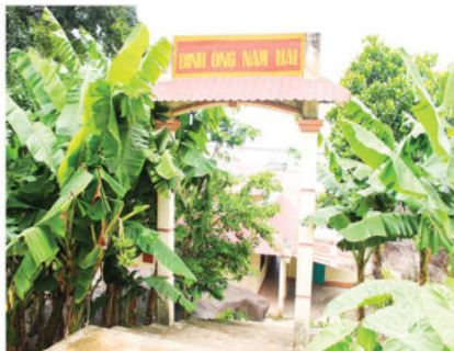
Lăng Ông Nam Hải, xã Hòn Tre

Lăng cá Ông không chỉ là nơi diễn ra các hoạt động sinh hoạt tín ngưỡng của người dân địa phương trên đảo mà còn là điểm tham quan của nhiều du khách gần xa. Trong Lăng có đặt thờ một bộ xương cá voi dài đến 9,5 m, rộng 3,5 m.