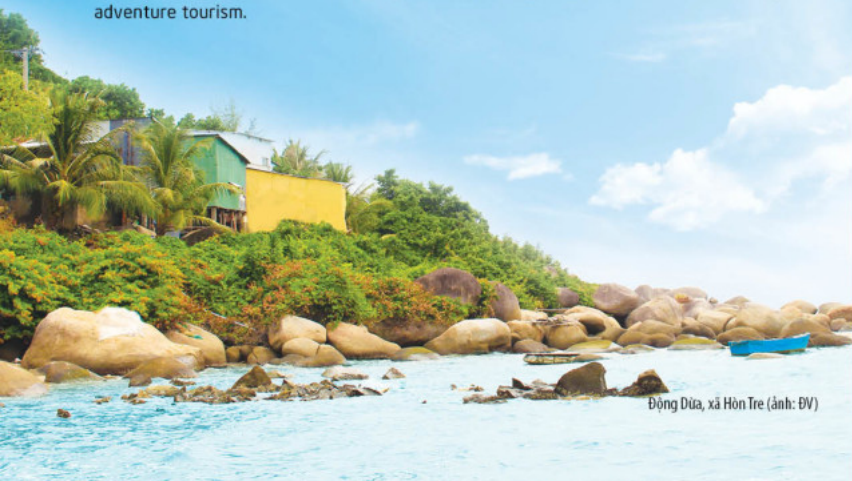
Động Dừa, xã Hòn Tre

Dong Dua is a cove formed by many stacked rocks, creating a small cave's bay. Especially, there are ancient ceramic jars made of Sa Huynh clay found in such cave's bay. This is an eco-tourism destination extremely attractive for young people who like this type of adventure tourism.