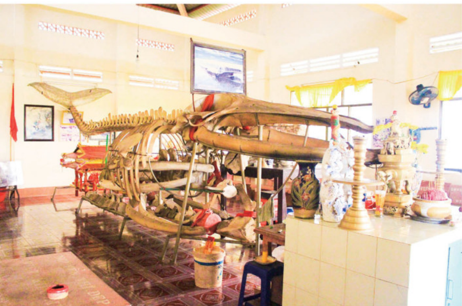
Xương Cá Ông ở Dinh Cá Ông, Hòn Tre

WORSHIPING CEREMONY OF CA ONG (LORD WHALE) PALACE