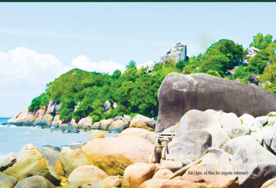
Bãi Chén, xã Hòn Tre