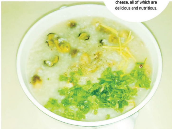
Cháo hào

Hon Tre milk oysters has soft meat, fatty taste, rich sweetness and very high nutritional content. Visitors can enjoy this specialty in many ways, such as congee, oyster grilled with onion or grilled with cheese, all of which are delicious and nutritious.