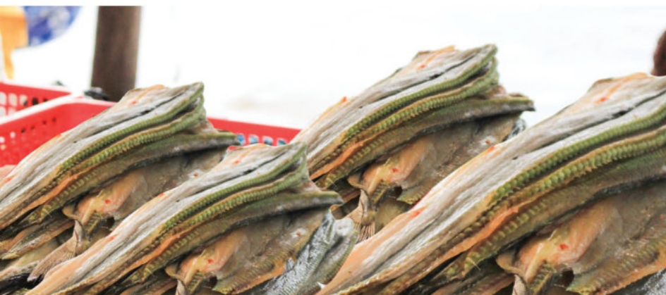
Khô cá xương xanh

Nguồn hải sản phong phú và đa dạng là điều kiện để Kiên Hải sản xuất nhiều loại khô thơm ngon nổi tiếng. Du khách đến với huyện đảo thuộc vùng biển Tây Nam này không thể không thưởng thức các món ngon được chế biến từ khô cá đuối, khô cá xương xanh, khô tôm tít... Và đây cũng chính là những món quà vô cùng ý nghĩa cho bạn bè và người thân.