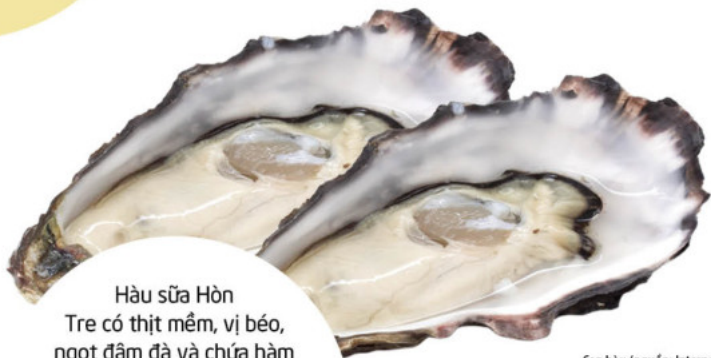
Con hào

Hàu sữa Hòn Tre có thịt mềm, vị béo, ngọt đậm đà và chứa hàm lượng dinh dưỡng rất cao. Du khách có thể thưởng thức loại đặc sản này theo nhiều cách như nấu cháo, nướng mỡ hành hay nướng phô mai đều rất thơm ngon và bổ dưỡng.