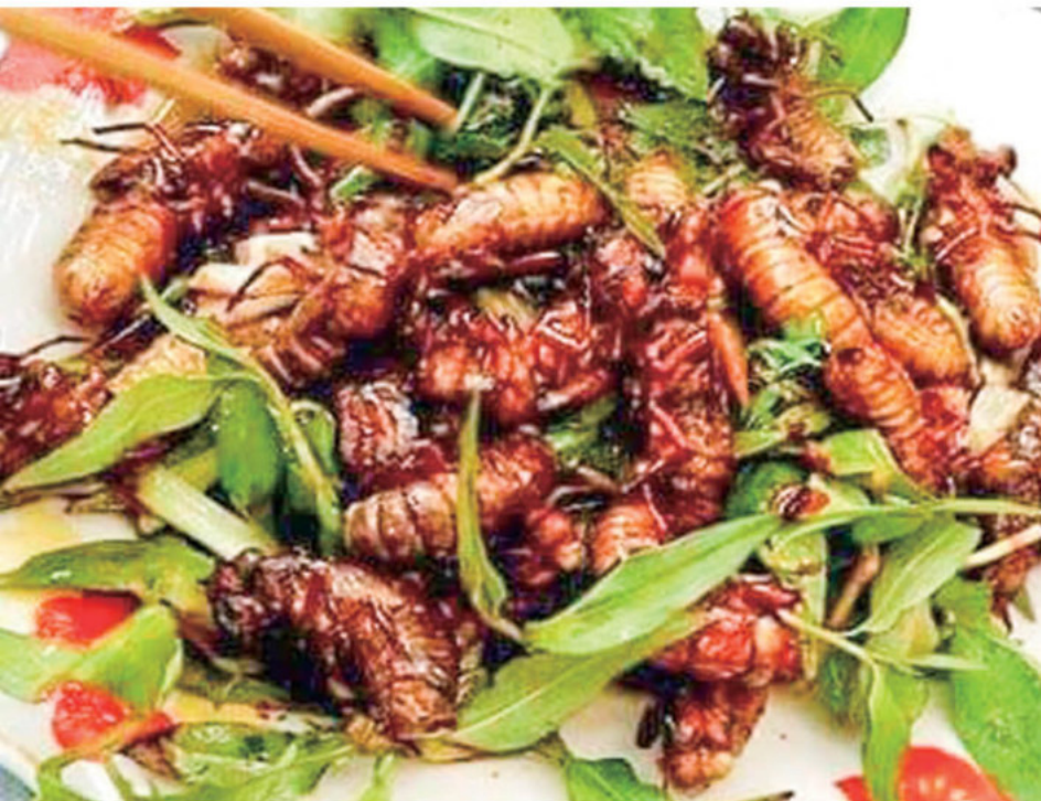
Nhộng ve chiên giòn

Trong chuyến du lịch Kiên Hải, du khách nhất định phải thưởng thức món ăn độc - lạ nhưng vô cùng thơm ngon chính là nhộng ve Hòn Tre. Có nhiều món cho bạn lựa chọn như nhộng ve kho tiêu hay nhộng ve nấu cháo nhưng ngon nhất vẫn là nhộng ve chiên giòn với vị ngọt và giòn rụm hấp dẫn đến khó cưỡng.