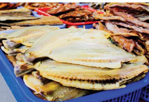
Các loại khô tại Kiên Hải

The rich and diversified source of seafood is the basis for Kiên Hải to produce a variety of famous and delicious dried seafood. Coming to this island district in the Southwestern sea, visitors cannot help enjoying the dishes made from dried stingray, dried needle fish, dried mantis shrimp... And these are also very meaningful gifts for your friends and relatives.